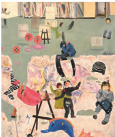
参考作品 [ 絵画表現 ]