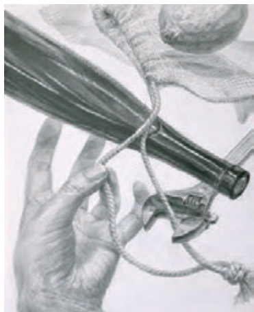
東京藝術大学 デザイン科 合格者 参考作品