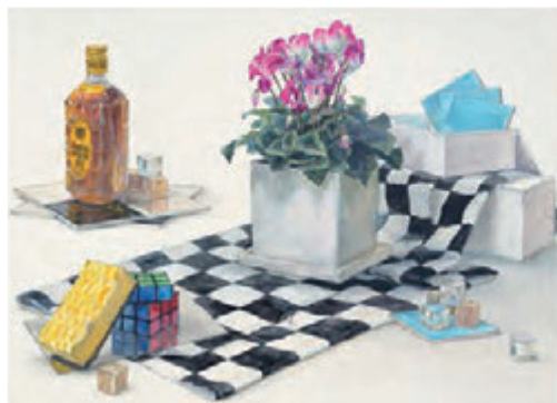
参考作品 [静物着色]