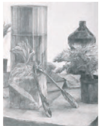
静物デッサン [木炭紙大画用紙・鉛筆]

講評会は、制作した作品に対して講師が「長所や短所」「これからのテーマ」などの確かな指摘とアドバイスを与えます。また、他の人の作品と並べて観ることのできる大切な機会でもあります。