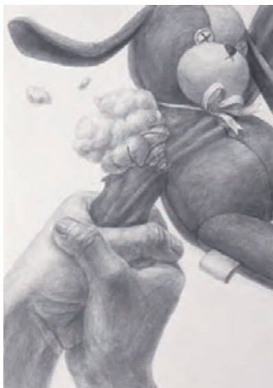
多摩美術大学 グラフィックデザイン学科 合格再現