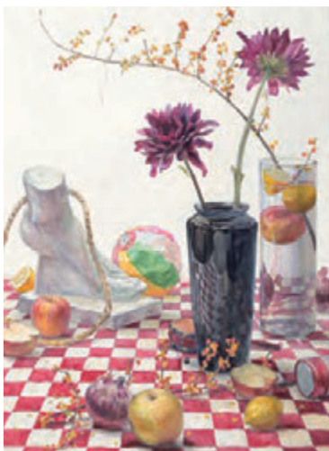
参考作品 [静物着色]