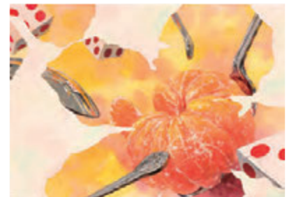
構成着彩 [B3画用紙・アクリル絵具]