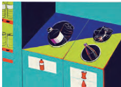
武蔵野美術大学 工芸工業デザイン学科 合格再現