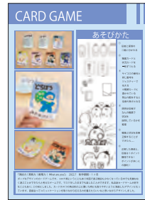
AO推薦入試対応ポートフォリオより(一部抜粋)