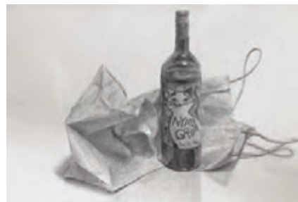
参考作品(デッサン)