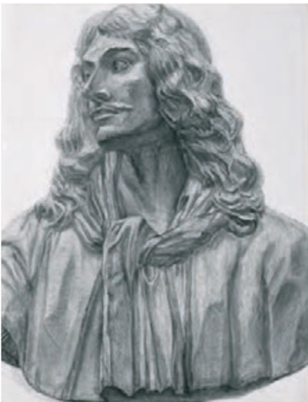
石膏デッサン [木炭紙・木炭]