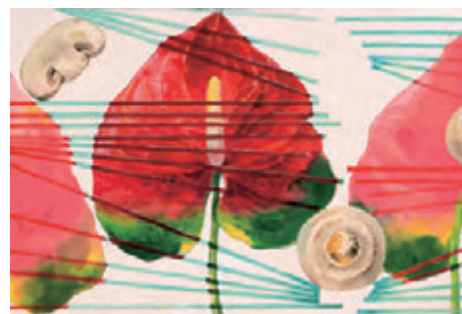
東京藝術大学 工芸科 参考作品