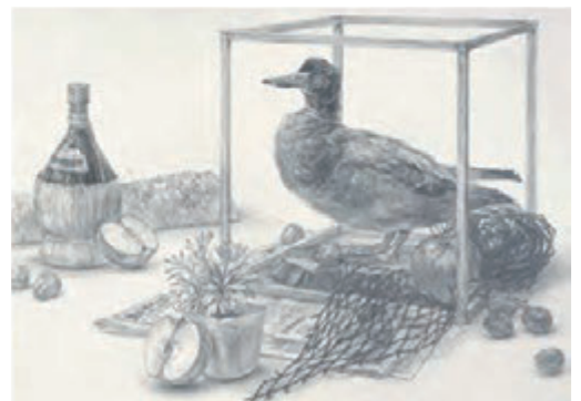
参考作品 [静物デッサン]