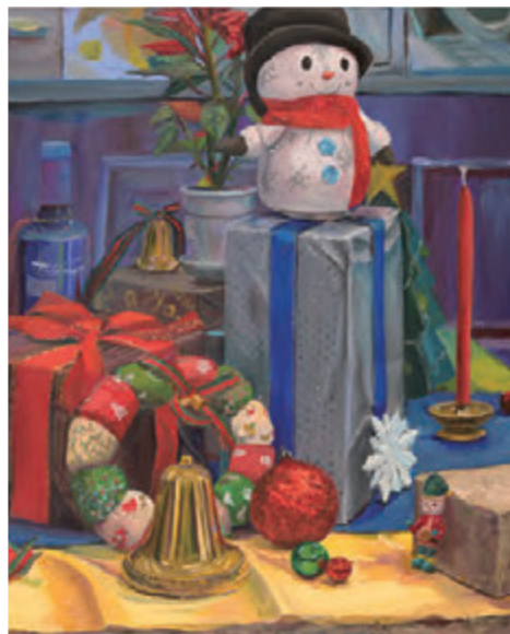
静物着彩 [F15キャンパス・油絵具]