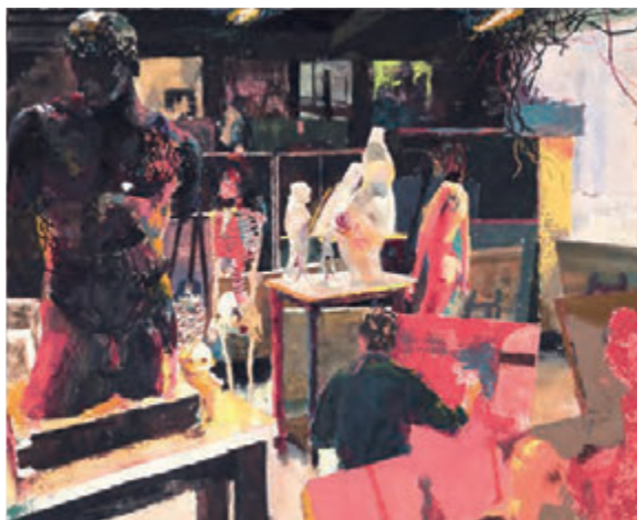
参考作品 [ 絵画表現 ]