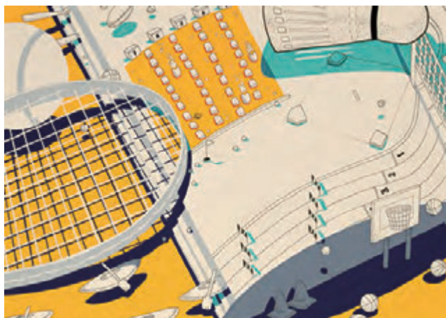
東京藝術大学 デザイン科 合格再現