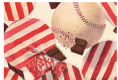
構成着彩 [B3画用紙・アクリル絵具]