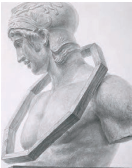
東京藝術大学 デザイン科 参考作品