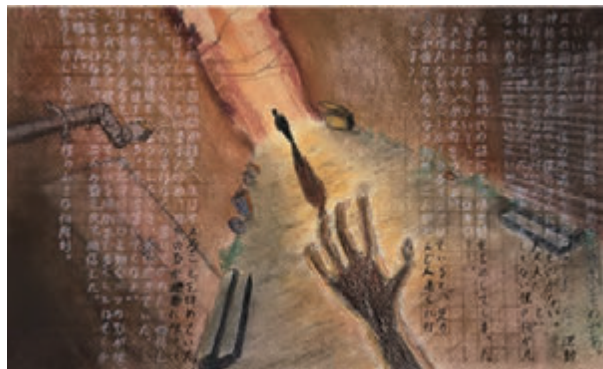
参考作品(イメージデッサン)