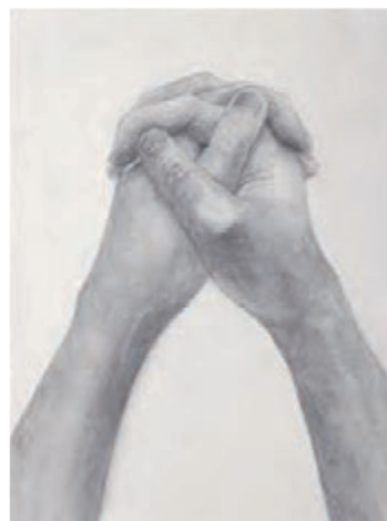
東京藝術大学 合格再現 [素描]