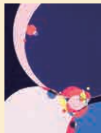
(筑波) 幾何平面構成