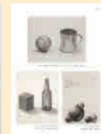
ポートフォリオ制作イメージ