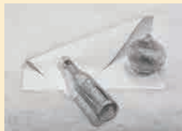
卓上静物デッサン (鉛筆)