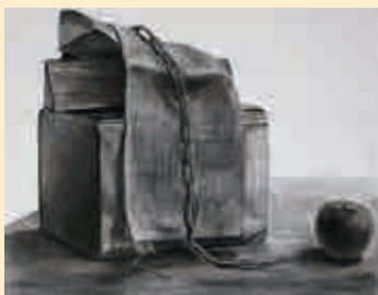
静物デッサン (木炭)