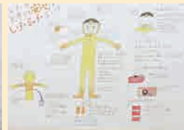
デザインプレゼンテーション・構想表現