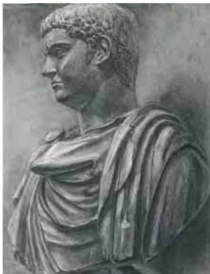
石膏デッサン [ 木炭紙・木炭 ]