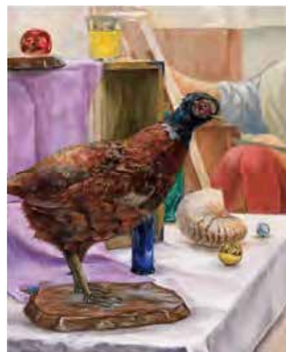
静物着色 [ F15キャンバス・油彩 ]