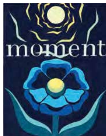
多摩美術大学 グラフィックデザイン学科 合格者参考作品