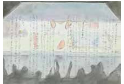
【イメージデッサン】(感覚テスト)武蔵野美術大学 合格者作品

●筆記用具 ●色鉛筆 ●デッサン用具 ●カッター ●定規 ●はさみ ●糊 ※その他は期間中に案内します