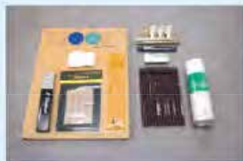
初めてのデッサンセット

これから実技を始められる方のために、着色用具セット(アクリル・水彩・油彩)を販売しています。どうぞご利用下さい。 ※セット内容は変更する場合があります。詳しくは当学院までお問い合わせ下さい。