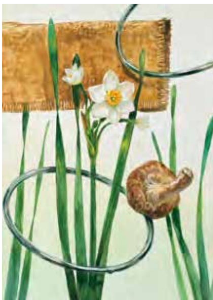
東京藝術大学 工芸科 合格者参考作品