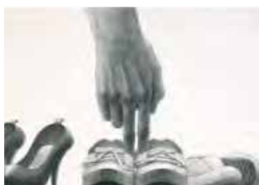
多摩美術大学 統合デザイン学科 合格再現