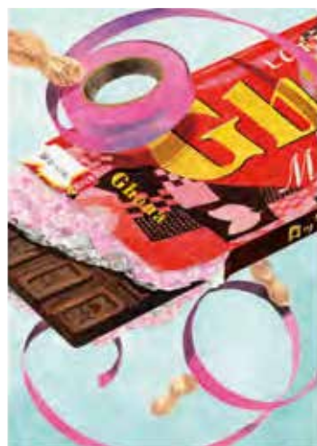
構成着色 [ B3画用紙・アクリル絵具 ]

講習会は、制作した作品に対して講師が「長所や短所これからのテーマ」などの確かな指摘とアドバイスを与えます。また、他の人の作品と並べて観ることのできる大切な機会でもあります。