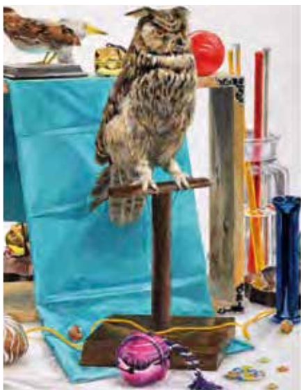
静物着色 [ 木炭紙大・アクリル絵具 ]