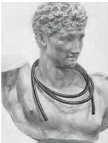
東京藝術大学 工芸科 合格者参考作品