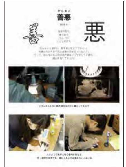
【ポートフォリオより一部抜粋】東京藝術大学 合格者作品