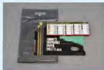
初めての水彩セット