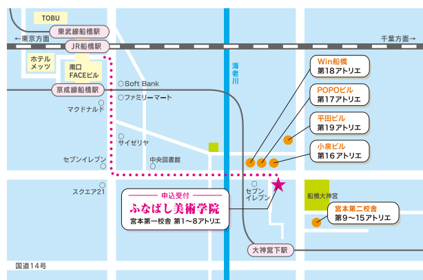
● JR総武線船橋駅南口・東武野田線船橋駅・京成線船橋駅より徒歩15分 ● 京成線大神宮下駅より徒歩5分

■ 学費 入会金¥5,000がかかります。 ※受講料ともに消費税を含む総額となります。(内税)