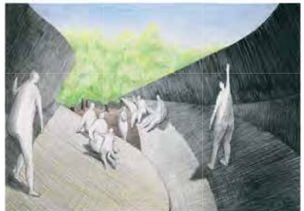
東京藝術大学 合格者入試再現作品(部分)