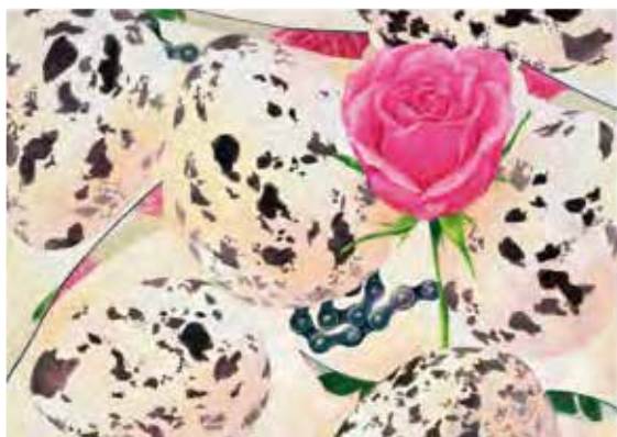
東京藝術大学 デザイン科 合格者参考作品