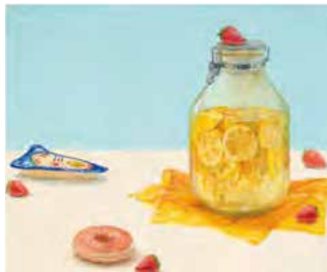
【静物着色】女子美術大学 合格者入試再現作品