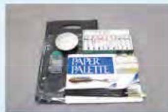
初めての油彩セット

紙パレット 筆洗油 油彩絵具 絵皿 筆(丸筆・平筆 等) オイル各種 ペインティングナイフ