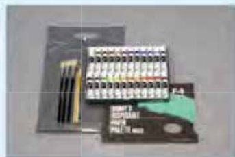
初めてのアクリルセット

クローキープック Dスケール カッター フキサチーフ 鉛筆(6H~6B) ガーゼ 練り消しゴム 木炭 目玉クリップ はかり棒 芯抜き