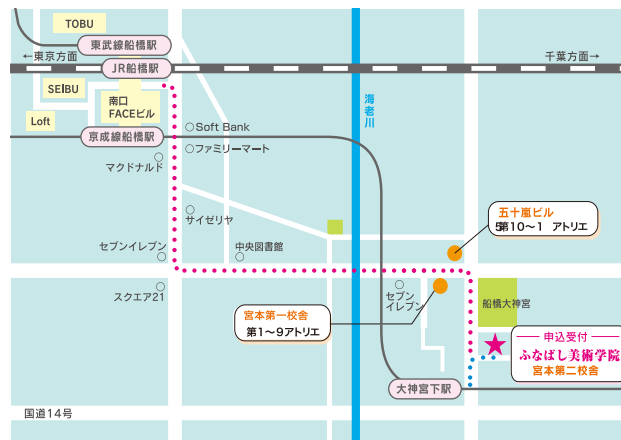
●JR総武線船橋駅南口・東武野田線船橋駅・京成線船橋駅より徒歩15分 ●京成線大神宮下駅より徒歩5分